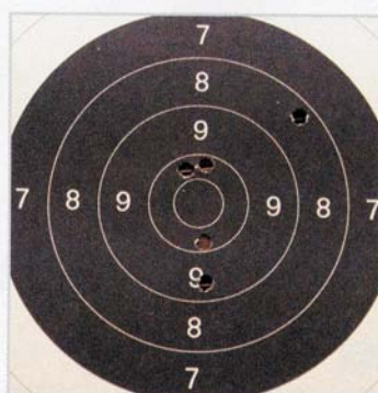
Dritte Serie: 1 × 8, 1 × 9, 3 × 10.

Diese Ergebnisse sprechen für sich, addiert zu einer 15-