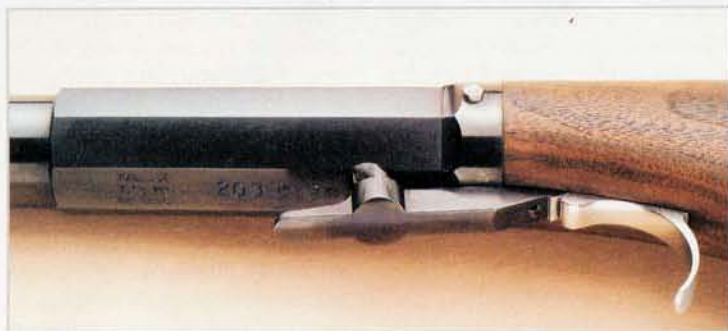
Das Schloss der Optima von unten. Deutlich zu sehen, sind die Beschusszeichen, die Seriennummer sowie das Piston.

Überraschung gab es bei der Pulversorte: Trotz des kleinen Kalibers lautet die Empfehlung auf 11 gr Schweizer Nr. 2. Dazu die Begründung von Tilo Dedinski: Unterhammerpistolen übertragen den Schussimpuls direkter in die Hand als herkömmliche Vorderladerpistolen. Beim Einsatz des schnelleren Pulvers Schweizer Nr. 1 wird dies deutlicher wahrnehmbar.