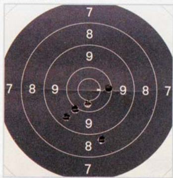
Erste Serie: 1 × 8, 2 × 9, 2 × 10.

Schuss-Gruppen von 22 mm. Der Lauf wurde übrigens nicht zwischengewischt. Leider ist das Fett nicht mehr in Deutschland erhältlich.