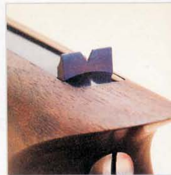
Die höhenverstellbare V-Kimme.

Eigentlich überflüssig zu erwähnen, dass sich die Opti-